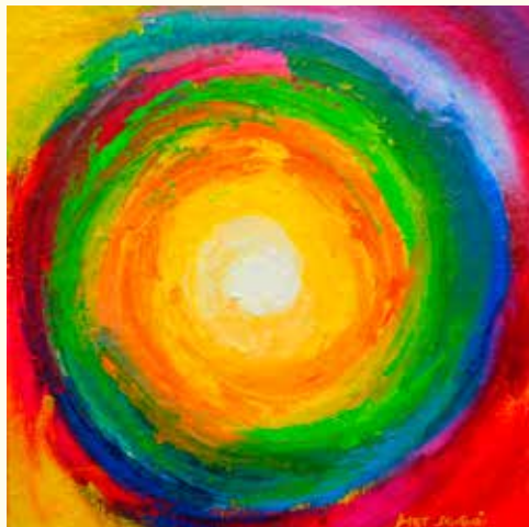
"VORTICE" - 2014 (olio e carta su tela - cm. 60 x 60)