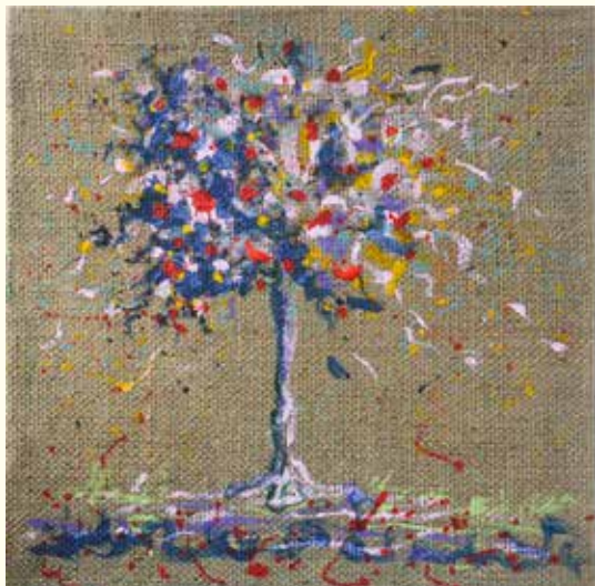
"ANNA" (Acrilico su juta)

L'energia si materializza e si plasma, a volte diventa luce e colore se non parole e musica.