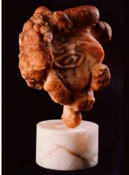
"GIANCARLO" - 1995 (agata - alabastro - cm. 33 x 32 x 18)

Dietro ogni opera di Rosy si nasconde una storia, scolpita con umana dolcezza e senso forte di attaccamento alla vita.