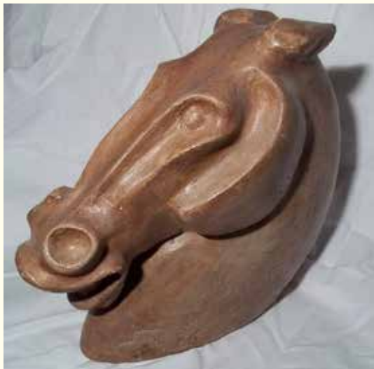
"CAVALLO" (cultura in terracotta)